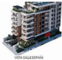
VISTA CALLE ESPAÑA