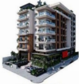
VISTA CALLE HAMBURGO