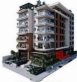
VISTA CALLE HAMBURGO