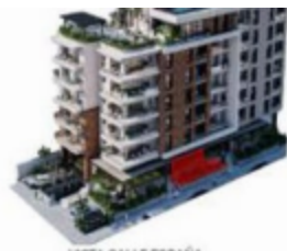
VISTA CALLE ESPAÑA